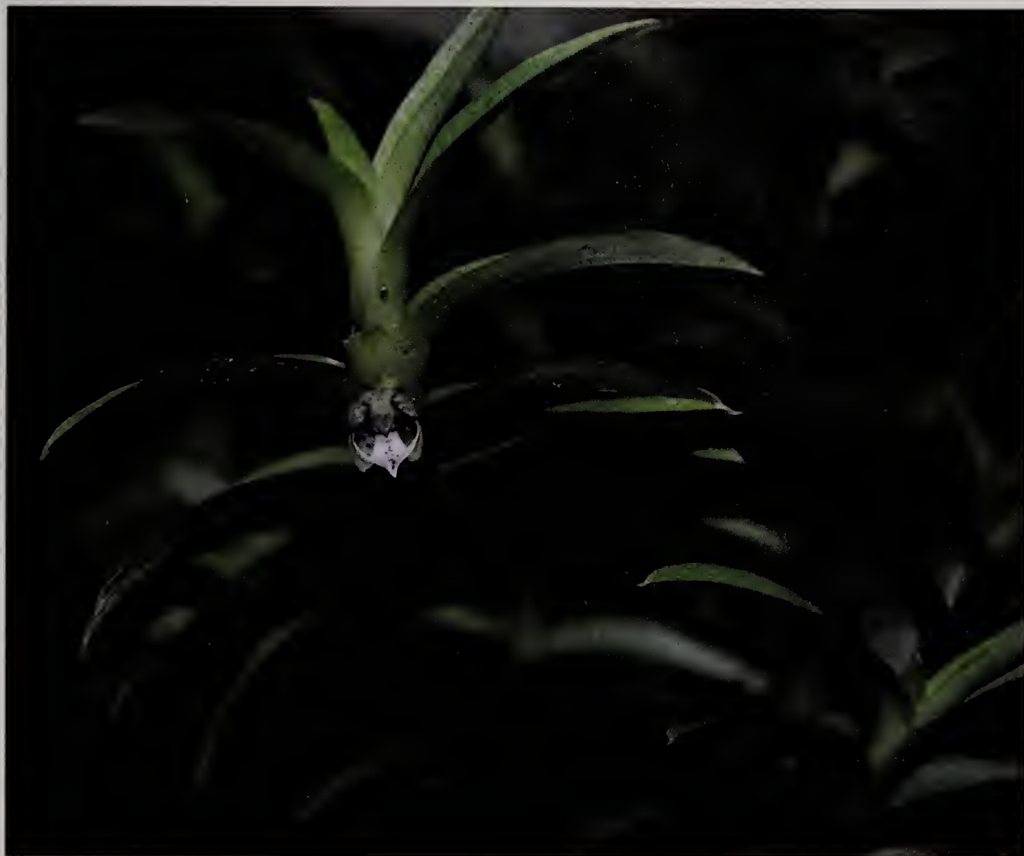
Fig. 3 : Dichaea elliptica

Matériel collecté : Guatemala, Alta Verapaz, Cobán, Finca Inupal, col. Fredy Archila & Francisco Archila, alt. 400 m, 06/2005, FA sn (BIGU).